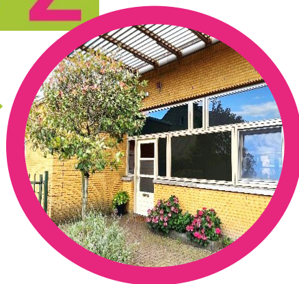
Regulushof 40 - Dordrecht