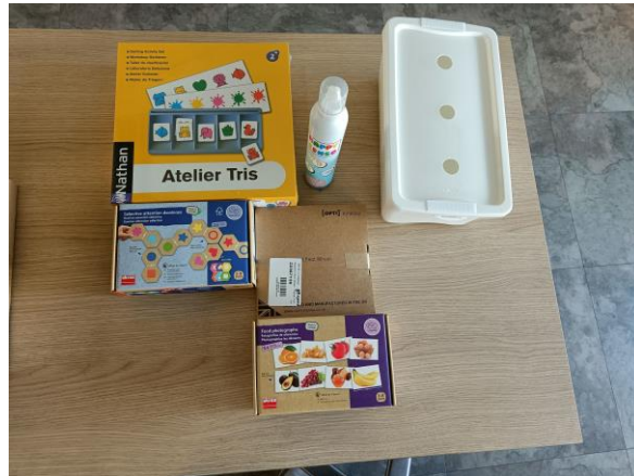
Spelmateriaal voor M. van Oranjestraat 7 Lingeolder