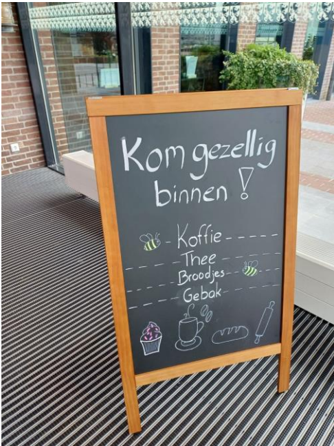
Uitklap-/reclamebord Werkcafé Alblaserdam