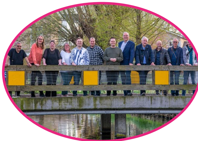
CCR (centrale cliëntenraad) ASVZ