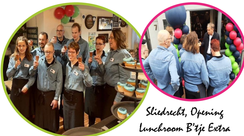
Sliedrecht, Opening Lunchroom B'tje Extra

In de lunchroom worden tevens mooie handgemaakte producten verkocht. Deze zijn gemaakt door cliënten op verschillende dagbesteding locaties van ASVZ.