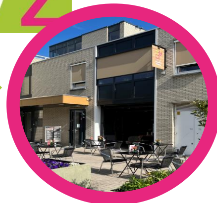
Hoogvliet, Fietscalé