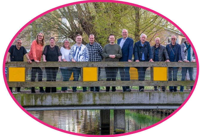
CCR (centrale cliëntenraad) ASVZ