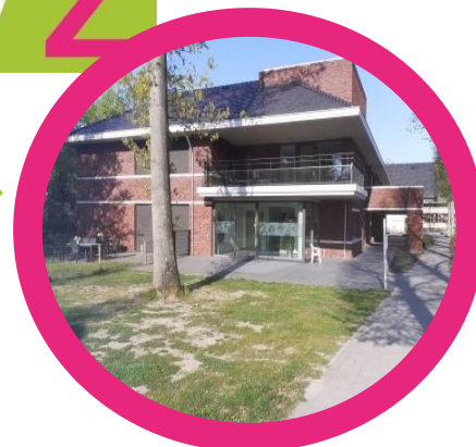
Brabant, Dagbesteding