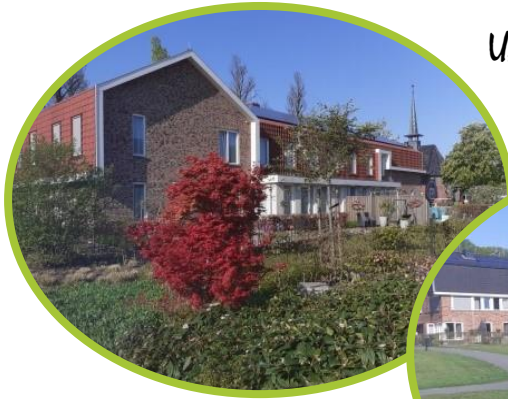
Udenhout, 2 onder een kap woningen

Ik zelf zit binnen deze raad in de werkgroep nieuwbouw/verbouw en probeer de ontwikkelingen hierover te volgen. Gelukkig heeft de afgelopen 8 jaren al veel nieuwbouw op het terrein van Vincentius plaatsgevonden waarover iedereen (volgens mij) erg te spreken is. Zie hieronder enkele mooie resultaten.