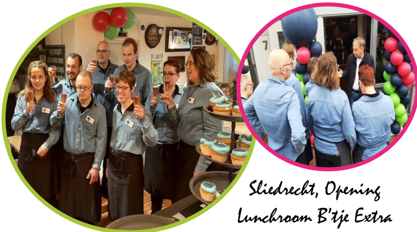
Sliedrecht, Opening Lunchroom B'tje Extra