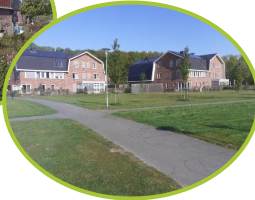
Udenhout, kwadrant woningen