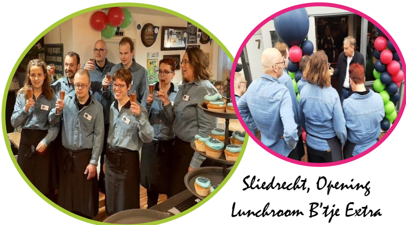
Sliedrecht, Opening Lunchroom B'tje Extra