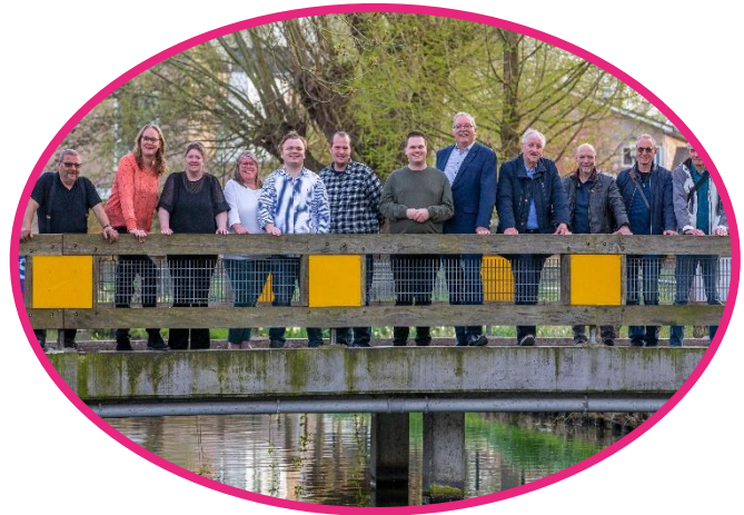
CCR (centrale cliëntenraad) ASVZ