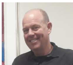
Nick Pot lid werkgroep wonen